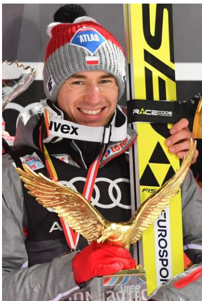
Kamil Stoch mit dem Pokal der Vier-Schanzen-Tournee 2016/2017

Für Polen hat der Skisprung eine ganz besondere Bedeutung, da in den Städten Zakopane und Wisła { wizhua } zwei der wichtigsten und prestigereichsten Stationen des Weltcups im Skispringen stattfinden, zu dem sich jedes Jahr zehntausende Polen vor Ort und Millionen vor dem Fernseher einfinden. Die Begeisterung ist jedoch nicht nur auf Polen begrenzt, denn selbst bei den entlegensten Weltcup-Stationen wie in Japan sind die polnischen Fans zu finden. In den letzten Jahren hat sich Kamil Stoch, auch „König Kamil“ genannt, mit seinen Erfolgen besonders hervorgetan. Als einer von insgesamt nur drei Menschen hat er alle Springen der Vier-Schanzen-Tournee gewinnen können (neben Sven Hannawald und Ryōyū Kobayashi).