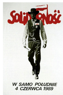
„12 Uhr Mittags. 4. Juni 1989“