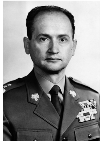
Wojciech Jaruzelski