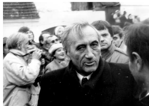
Tadeusz Mazowiecki © Artur Klose