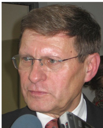
Leszek Balcerowicz