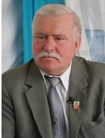
Lech Wałęsa

Erstellen Sie mit Hilfe des Internets Kurzbiografien zu den wichtigsten Akteuren des Transformationsprozesses in Polen und präsentieren Sie sie vor der Klasse: