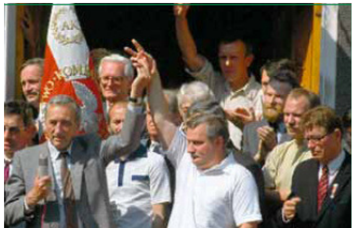
Tadeusz Mazowiecki und Lech Wałęsa nach dem Wahlsieg 1989